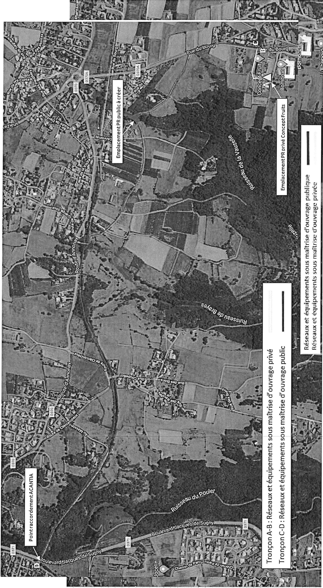
Annexe 2: Plan projet transfert_